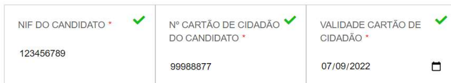
Imagem 2 - Campos de validação de candidatura